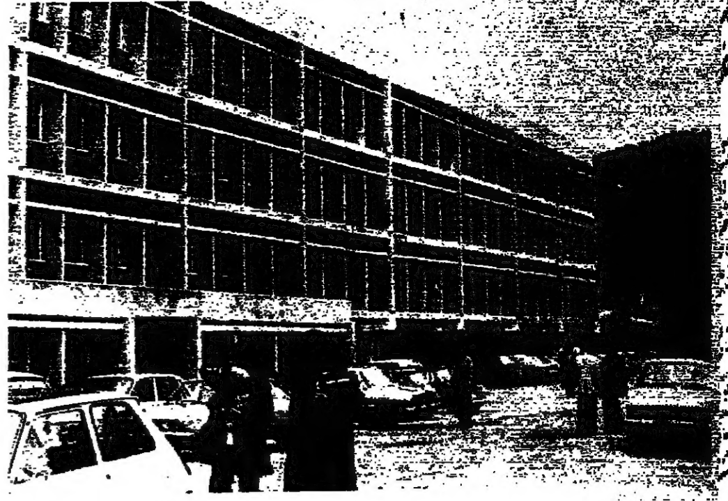
مبنى لـ... طلاب وطالبة